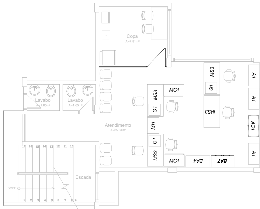
PLANTA BAIXA - TÉRREO